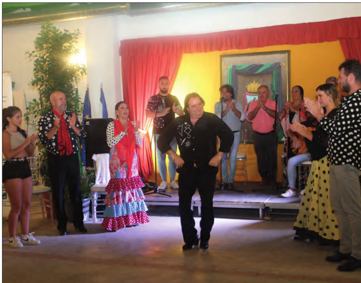
Artistas en el escenario de la caseta de la Federación Malagueña de Peñas.