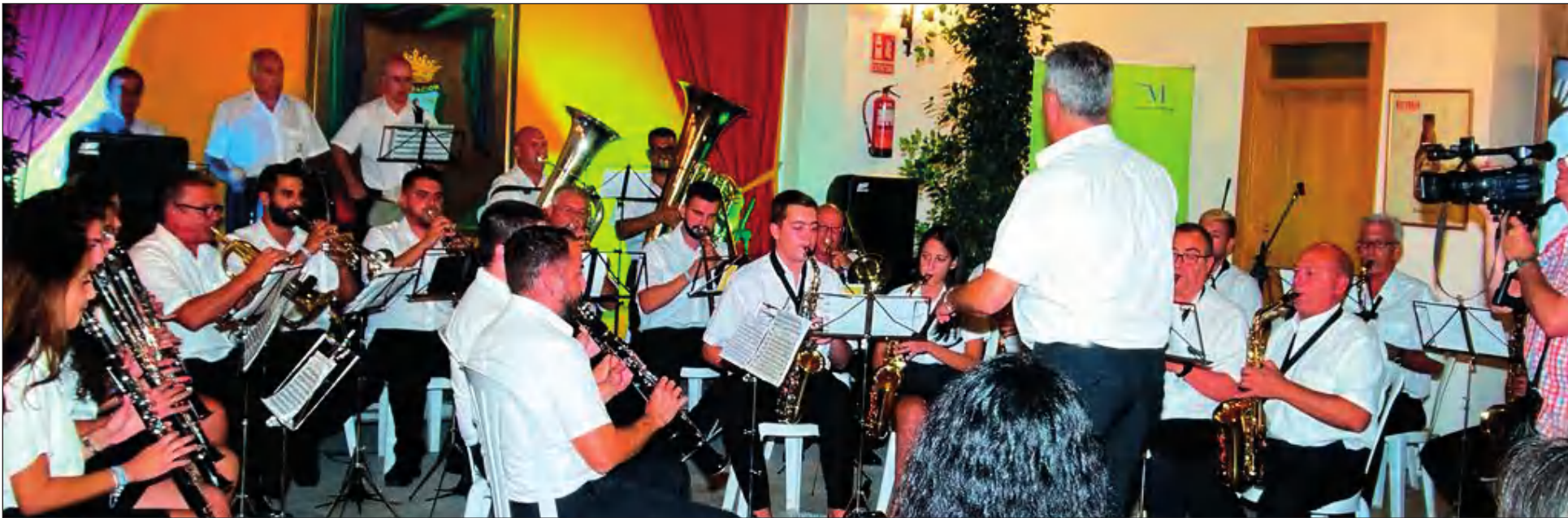
Actuación de la Banda de Música de Alozaina en la caseta de la Federación Malagueña de Peñas.

• FEDERACIÓN MALAGUEÑA DE PEÑAS, CENTROS CULTURALES Y CASAS REGIONALES 'LA ALCAZABA'