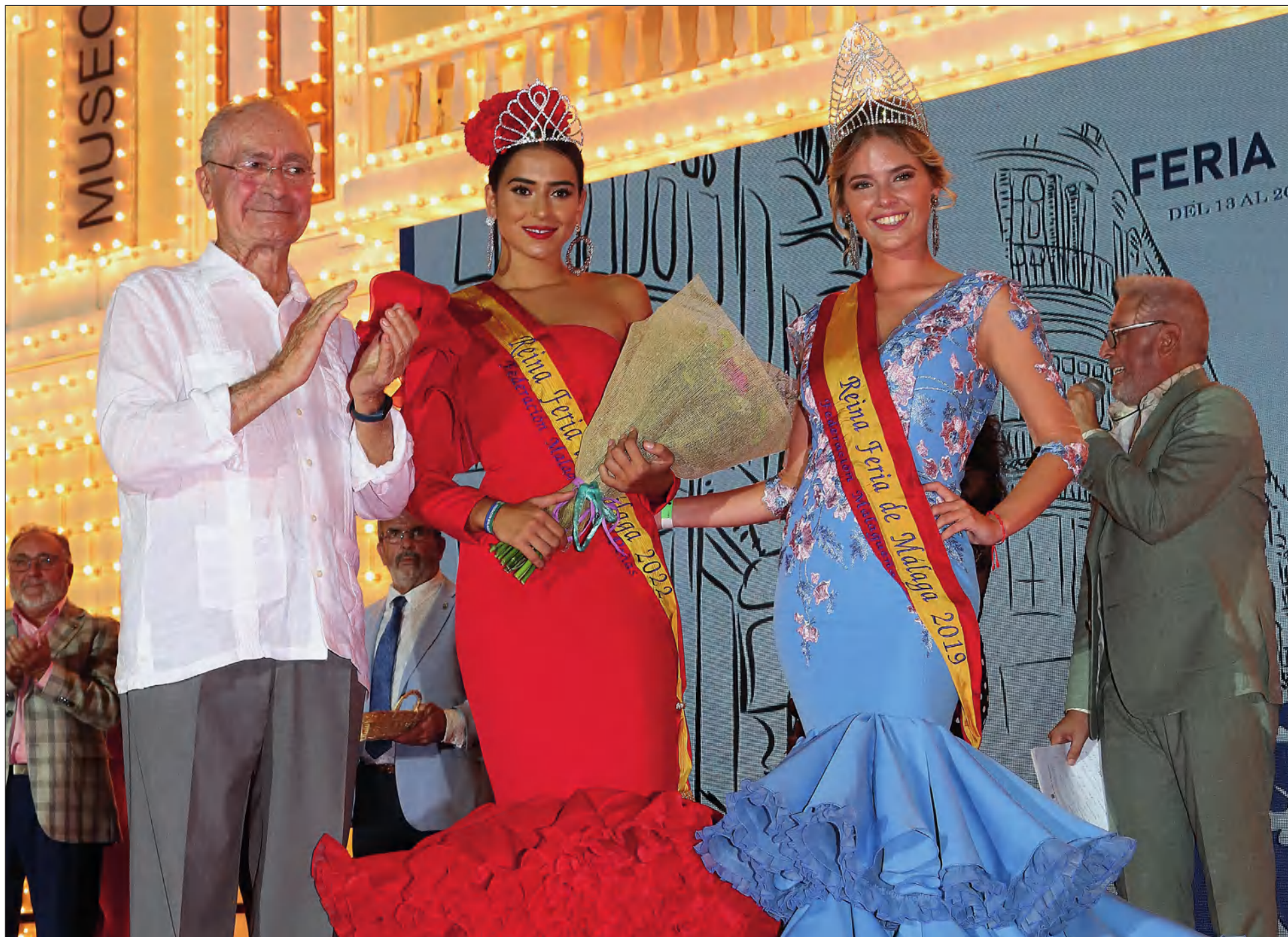
El alcalde de Málaga, con las Reinas de la Feria de 2022 y 2019.