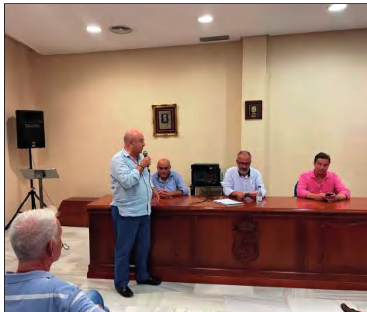
El presidente peñista da la bienvenida a los invitados y los asistentes.