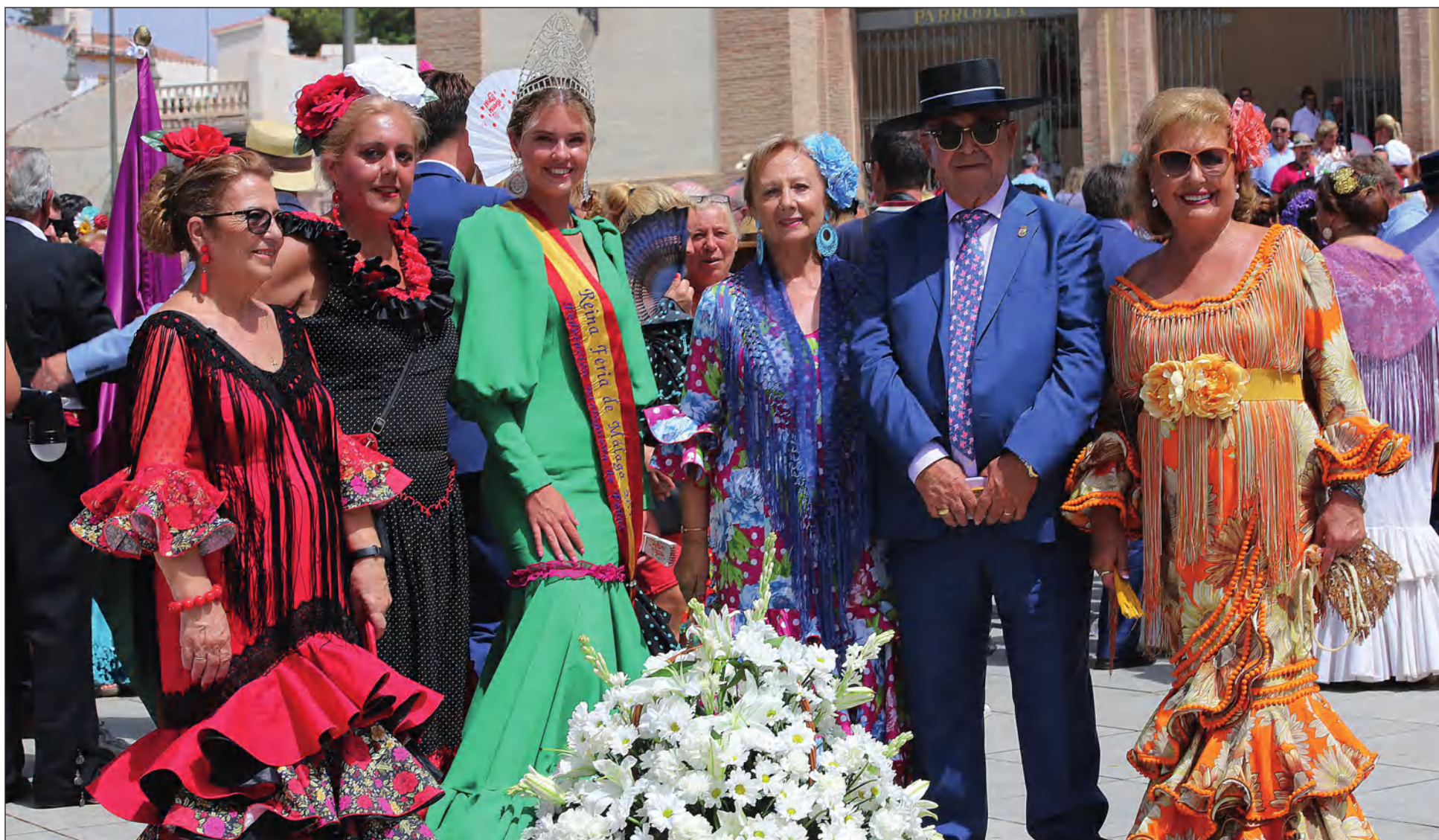
Representación peñista tras llegar a la plaza del Santuario en coche de caballos.