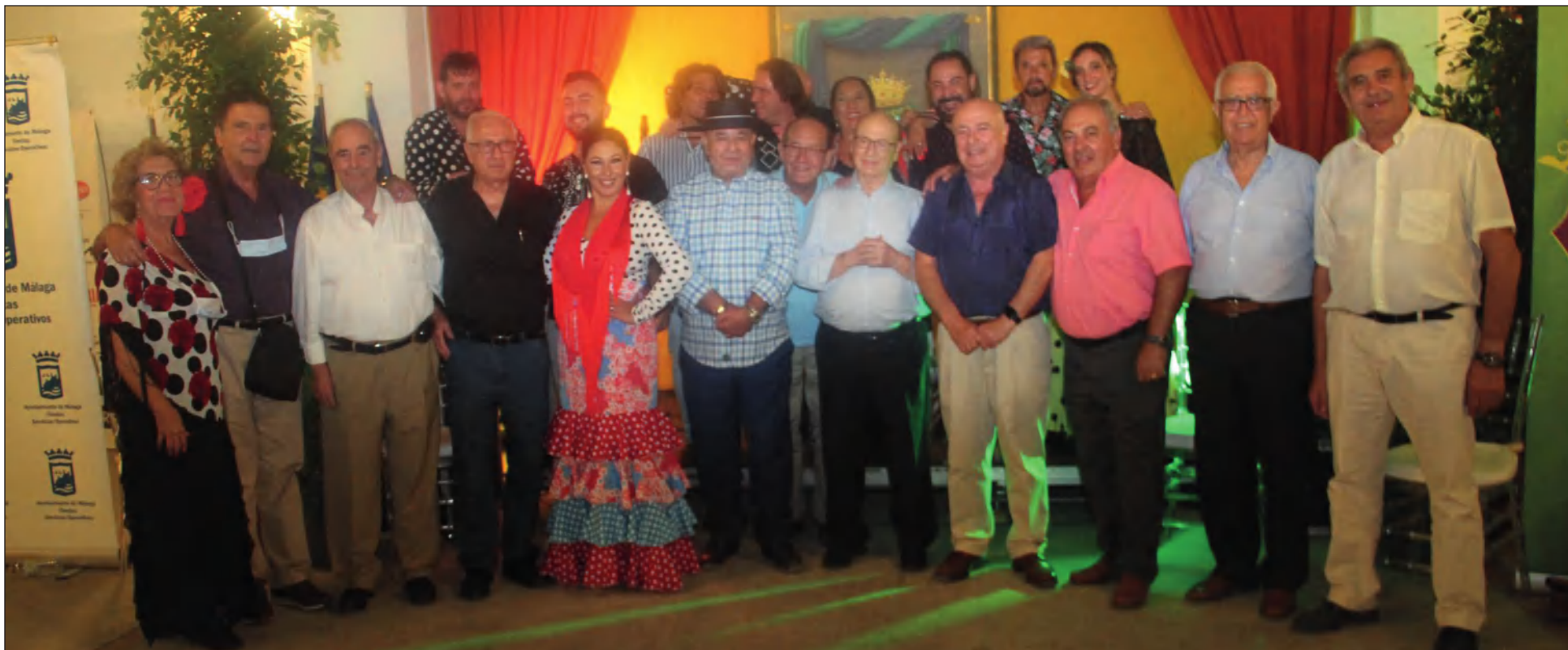
Asistentes al Encuentro Flamenco con la Peña Juan Breva, con la presencia de Fosforito.