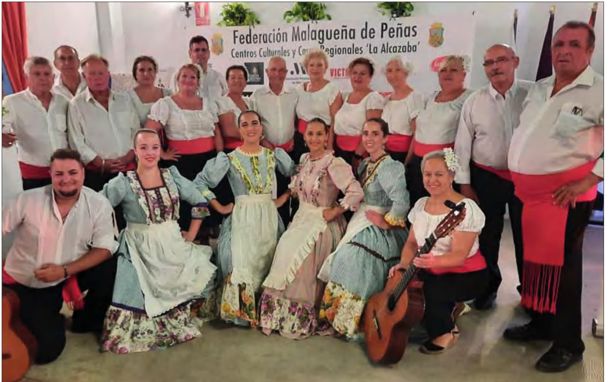
La Agrupación Folclórica Raíces y Horizonte estuvo presente el 18 de agosto en la caseta de la Federación Malagueña de Peñas en la noche de La Malagueña en Feria.