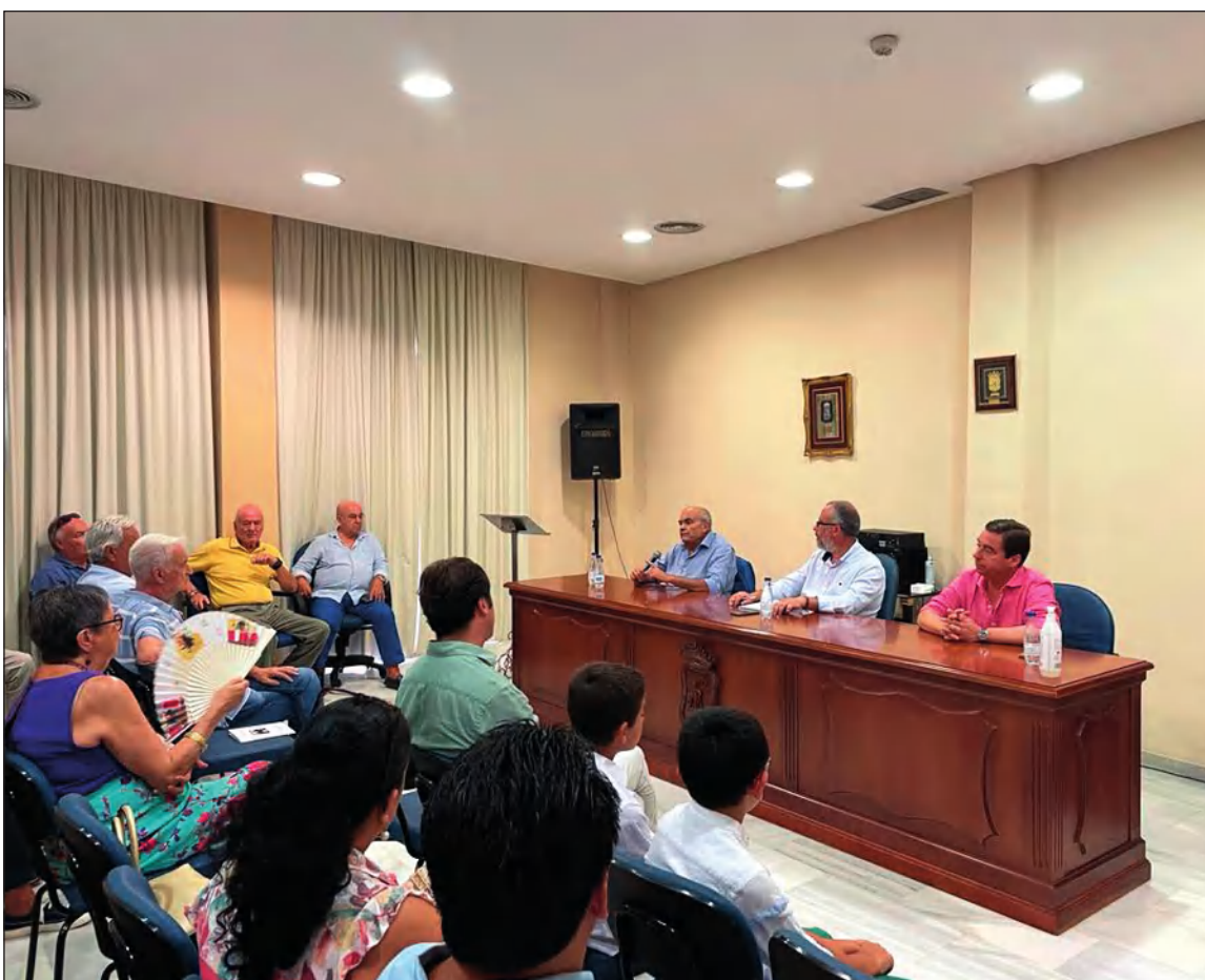
Vista general del salón de actos de la Federación durante la Tertulia Taurina del 10 de agosto.

Con el patrocinio de la Diputación Provincial de Málaga, y en colaboración con www.malagataurina.es y la Escuela Taurina de la Diputación, se trabaja en la organización de una nueva Tertulia Taurina para hacer un balance del resultado de esta edición de la Feria vivida en la plaza de toros de La Malagueta.