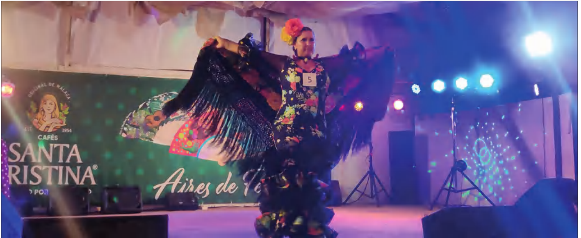
Pase de uno de los mantones participantes en la décimo octava edición de este tradicional concurso que regresaba a la Feria de Málaga.