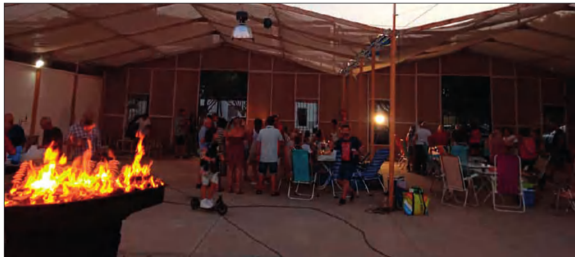
Vista general de la caseta durante la sardinada.