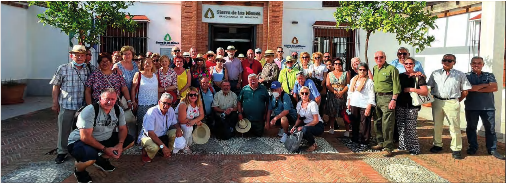
Visita realizada por la Federación Malagueña de Peñas a la Sierra de las Nieves el 12 de junio pasado.

• FEDERACIÓN MALAGUEÑA DE PEÑAS, CENTROS CULTURALES Y CASAS REGIONALES 'LA ALCAZABA'