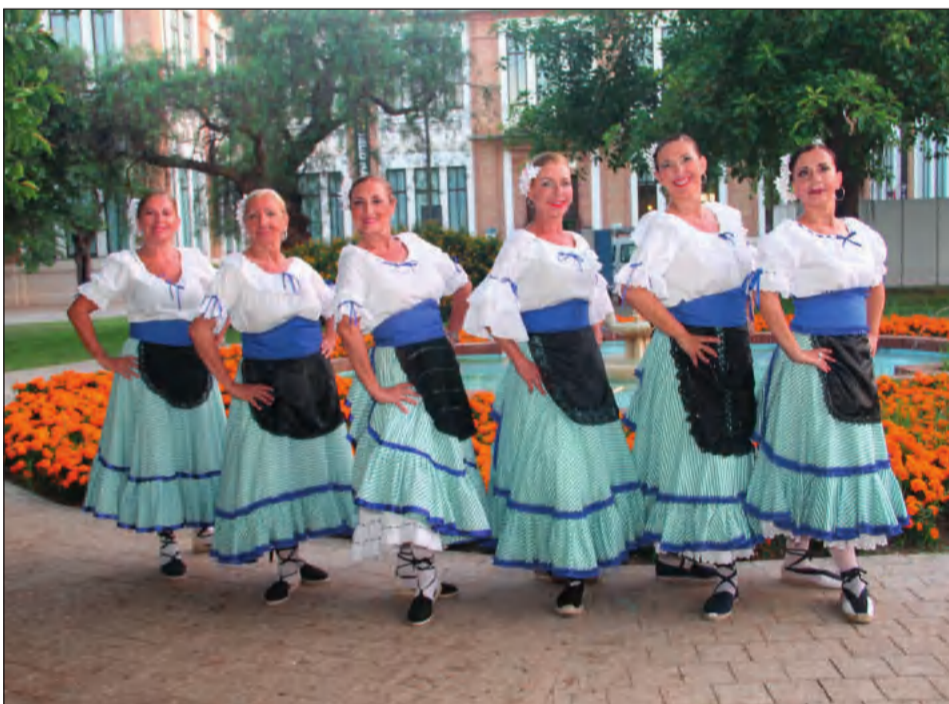
El baile volvió a ser un elemento fundamental dentro del certamen.