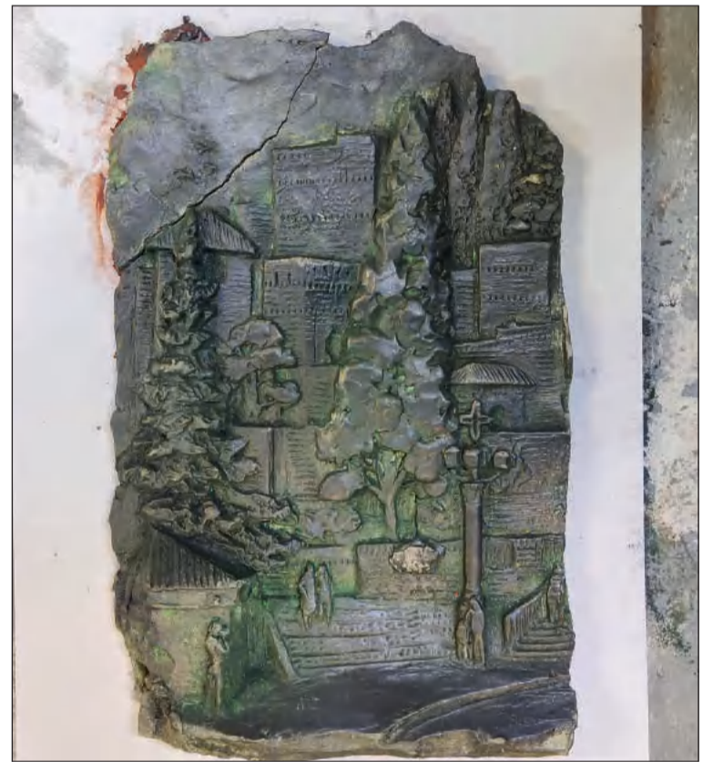
Detalle del premio, durante su proceso de creación.