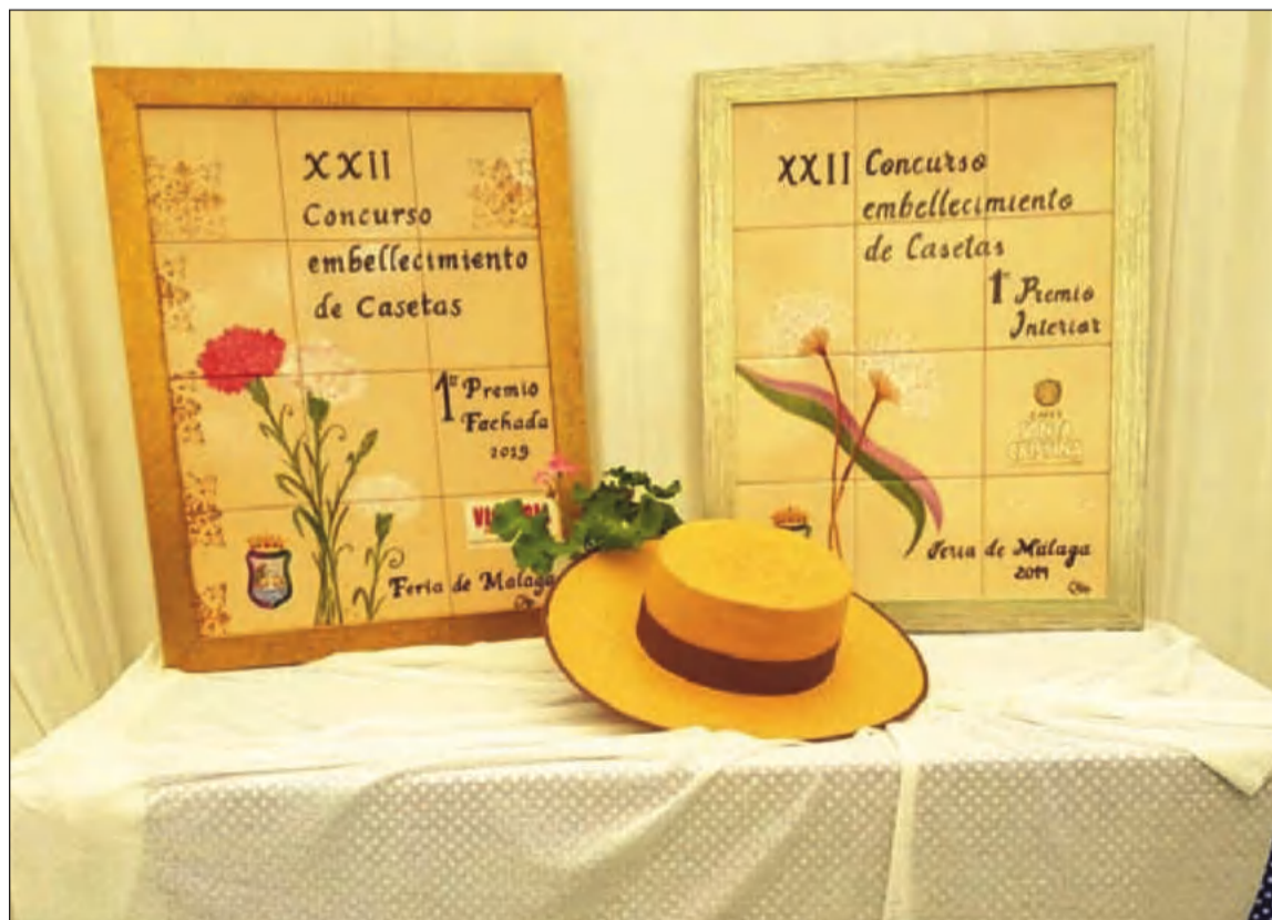
La Peña El Sombrero acaparó los primeros premios en su última edición de 2019.