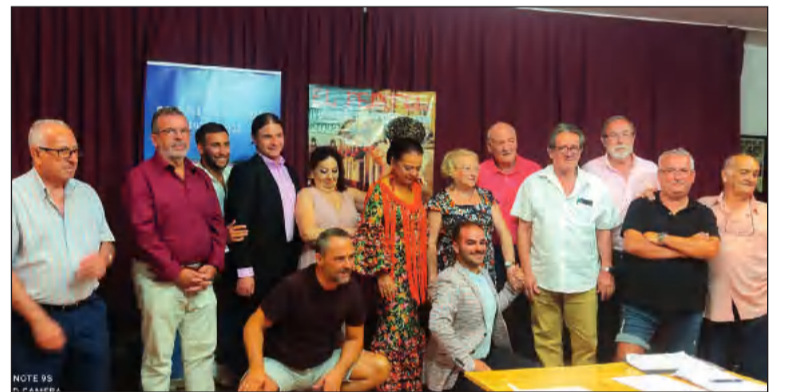
Primera semifinal del certamen de la Peña Perchelera.

Ya solo aguarda la celebración de su gran final, programada para el lunes 15 de agosto a las 22 horas en la caseta de esta entidad federada en el recinto ferial de Cortijo de Torres.