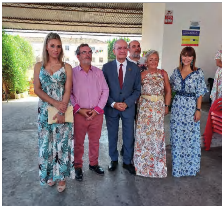
Representantes de la A.VV. Hanuca con los representantes municipales.