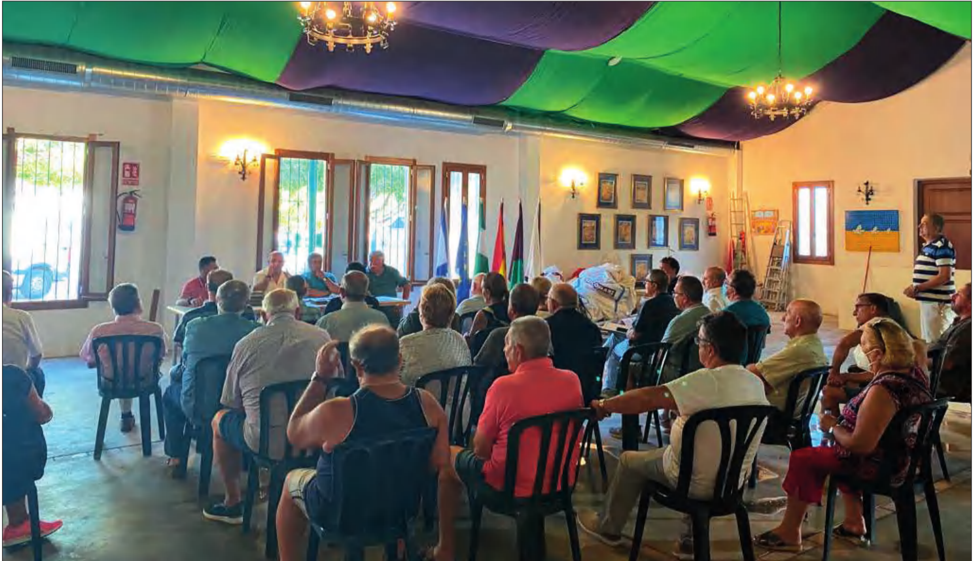
Un instante de la reunión mantenida en la caseta de la Federación de Peñas.

• FEDERACIÓN MALAGUEÑA DE PEÑAS, CENTROS CULTURALES Y CASAS REGIONALES 'LA ALCAZABA'