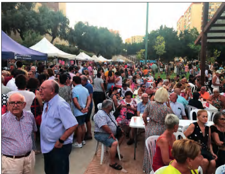
Gran ambiente en las actividades celebradas.