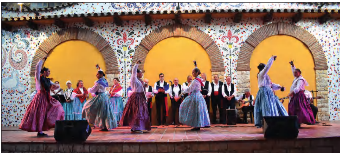
Un instante del festival celebrado en el Parque Municipal de Los Patos el pasado 27 de julio.