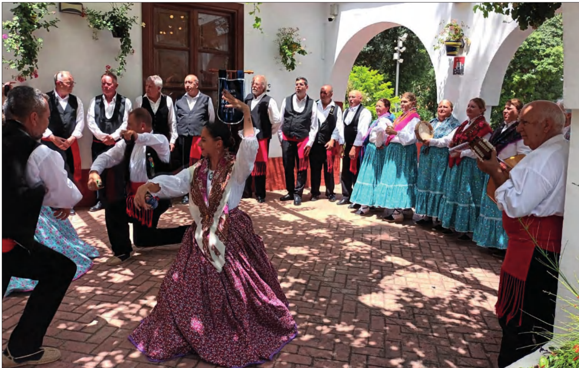
La Agrupación Folclórica Raíces y Horizonte estará presente el 18 de agosto en la caseta de la Federación Malagueña de Peñas en la noche de La Malagueña en Feria.