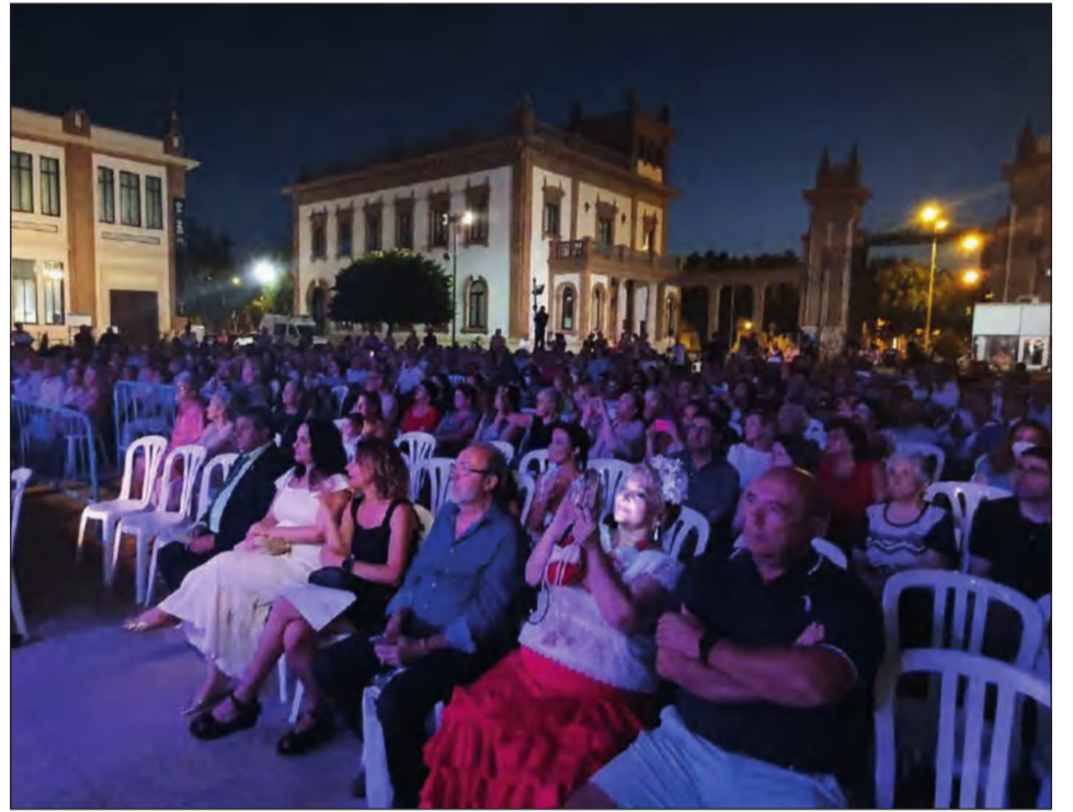
Aspecto que presentaba el Auditorio de los Jardines de Tabacalera.