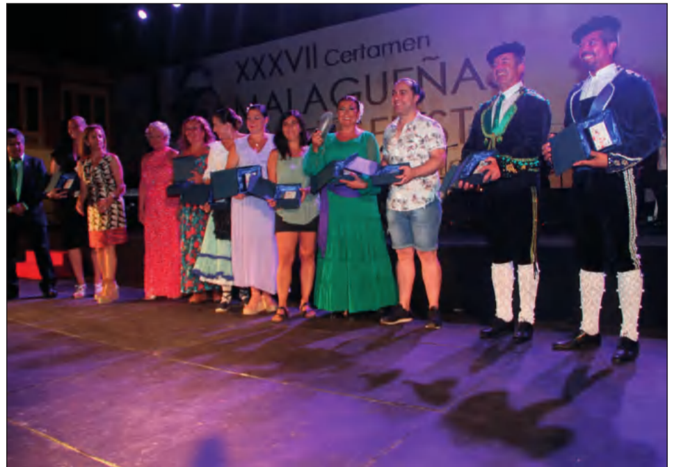
Acto de entrega de premios y recuerdos.