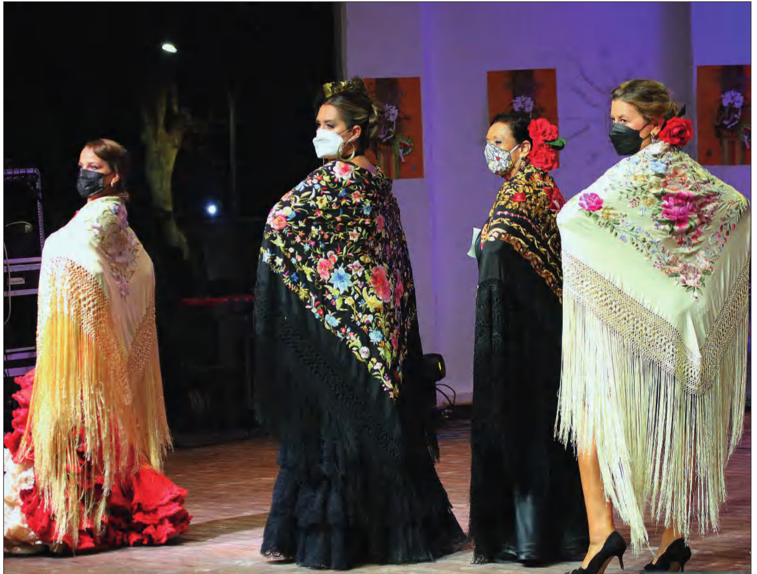
El Certamen de 2021 se celebraba en el Auditorio Eduardo Ocón.

El concurso contará con tres modalidades: Mejor Mantón de Manila Bordado, Mejor Mantón