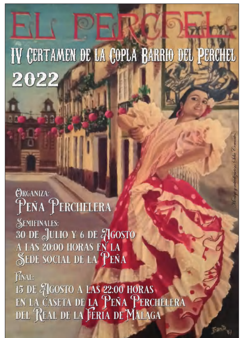
Cartel de la actividad