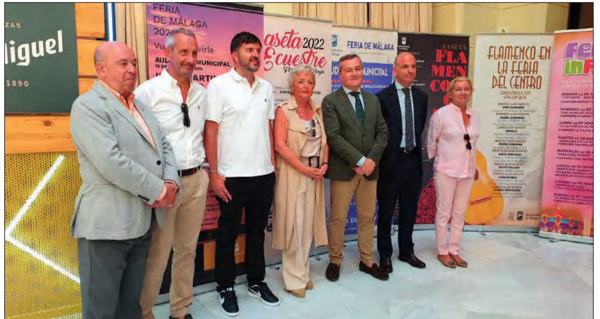
La Federación de Peñas estuvo representada en la presentación de la programación de las fiestas.

Por nuestra parte, quedan igualmente a vivirla en cualquiera de las casetas de las entidades que conforman esta Federación, y donde siempre serán bienvenidos.