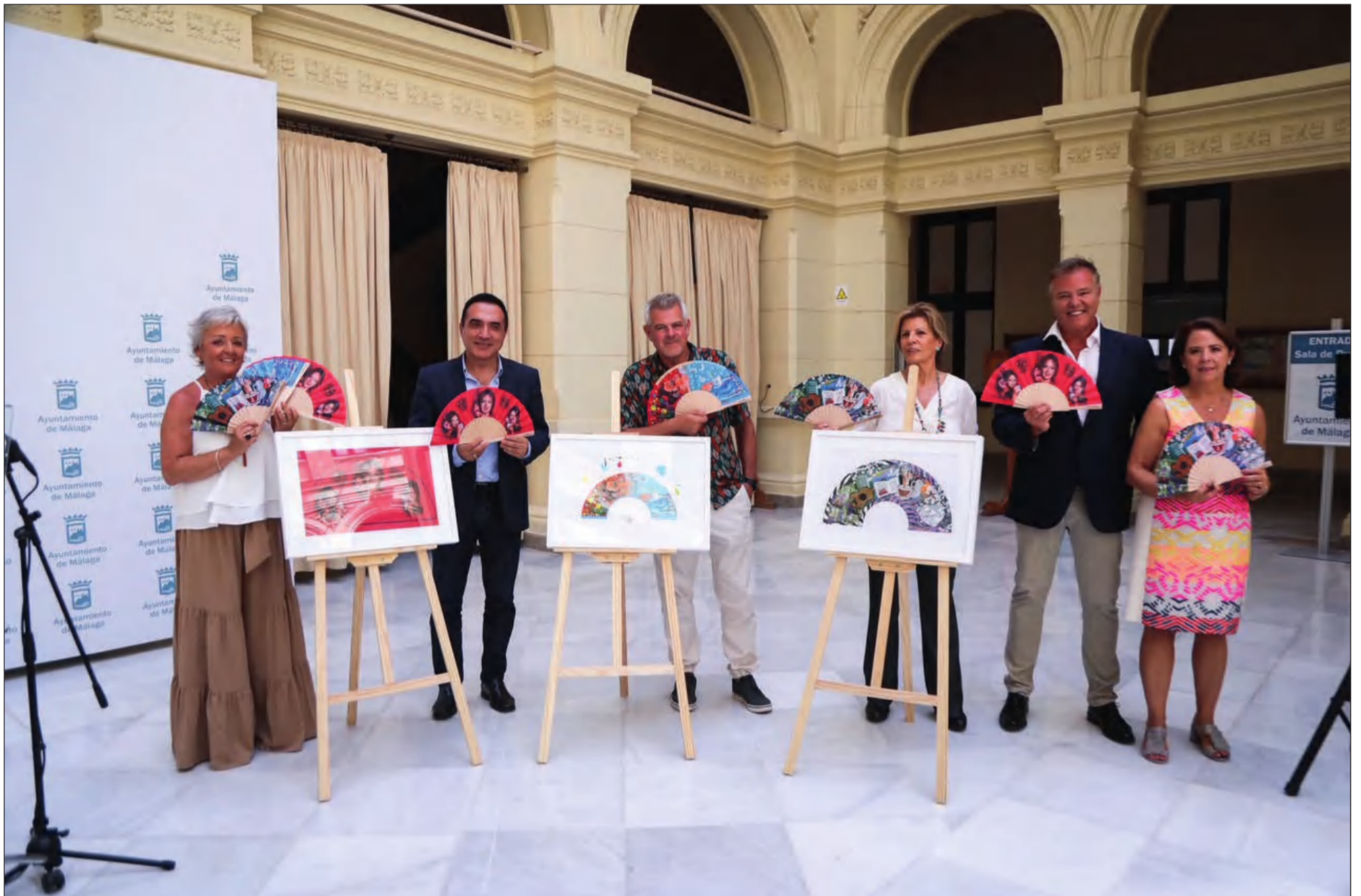
Presentación de los abanicos en el Patio de Banderas del Ayuntamiento de Málaga.