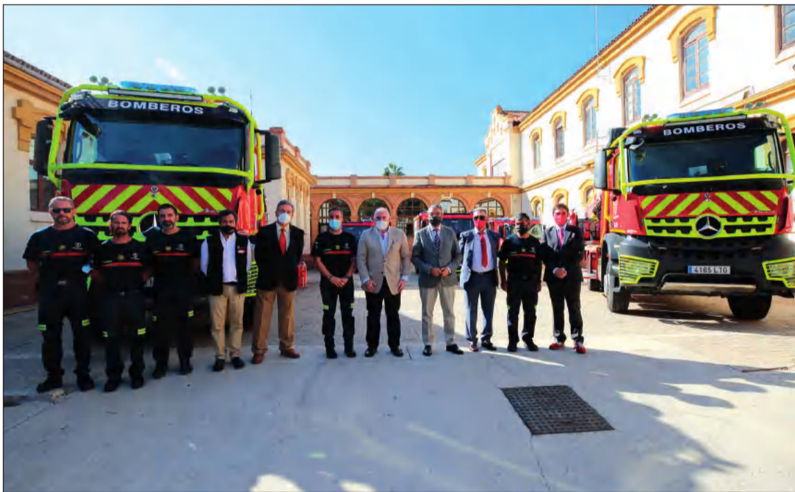
Representantes del Consorcio Provincial de Bomberos de Málaga.