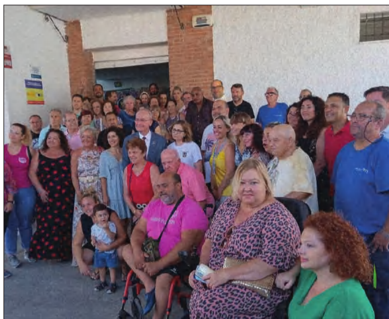
Imagen de grupo de los participantes en la actividad.