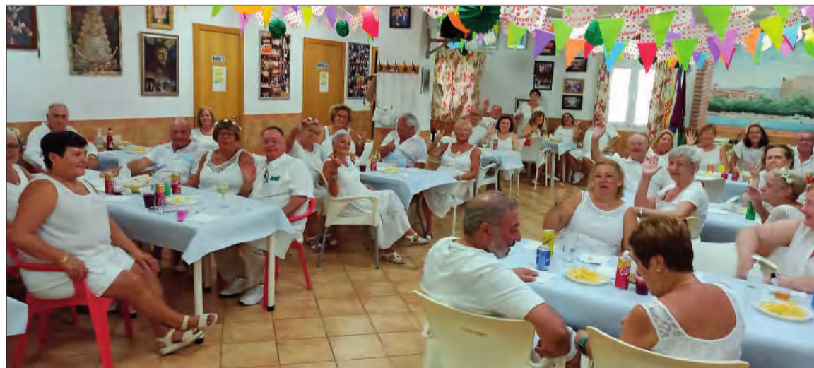
Integrantes de la asociación en Tolox.

llevó un plato para compartir con los compañeros y disfrutar de una jornada muy animada en la que todos acudieron vestidos de blanco.