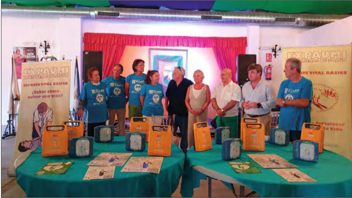
Entrega de desfibriladores en la caseta de la Federación de Peñas.

• FEDERACIÓN MALAGUEÑA DE PEÑAS, CENTROS CULTURALES Y CASAS REGIONALES 'LA ALCAZABA'