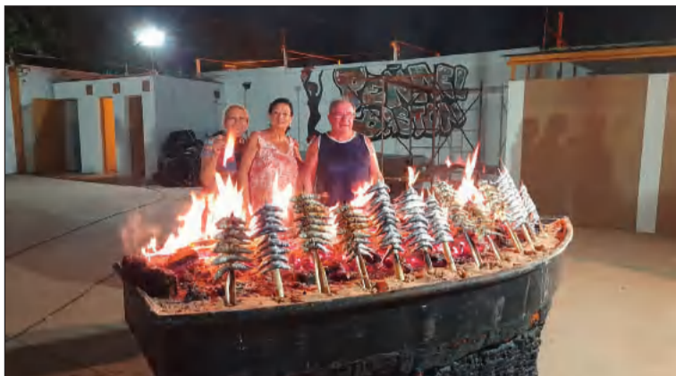
Preparativos de las sardinas.

Fue en la noche del 23 de julio, cuando en un ambiente muy familiar, los peñistas y sus familias llevaron mesas y sillas de playa para compartir una jornada de hermandad y camaradería.