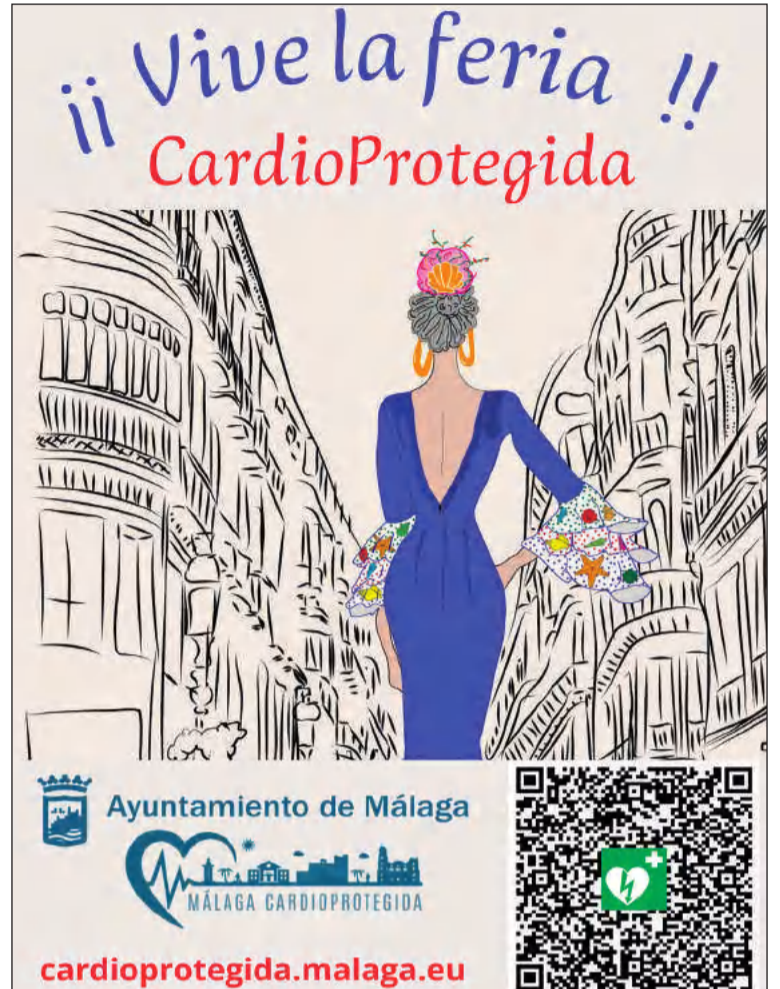
Cartel con código QR de la campaña.